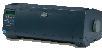
2600+, vista frontal